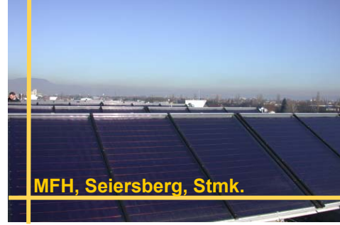
MFH, Seiersberg, Stmk.

Bauträger: Neue Heimat, gemeinnützige Wohnungs- und Siedlungsgenossenschaft in Steiermark Gmbh Wohneinheiten: 6 Kollektorfläche / Speichergöße: 30 m 2 / 2,5 m 3 Solarer Deckungsgrad vom Gesamtenergiebedarf: 16% Anwendung: BW und Raumheizungsunterstützung Bezugstermin: Juni 2003 Weitere Infos: r.riva@aee.at