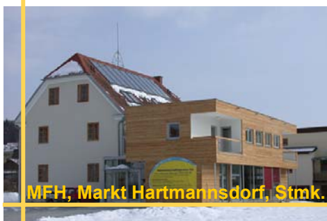
MFH, Markt Hartmannsdorf, Stmk.

Im Geschößwohnbau sind sogenannte „Zwei-Leiter-Netze“ die solarunterstützten Wärmenetze der Zukunft. Bei diesen Systemen erfolgt die Wärmeversorgung der Wohnungen sowohl für Brauchwasser als auch Raumwärme über ein Leitungspaar. Die Brauchwassererwärmung erfolgt dezentral in den Wohnungen im Durchflussprinzip bzw. über kleine Trinkwasserspeicher im Ladespeicherprinzip. Nachfolgend dazu einige best practice-Beispiele aus dem Jahr 2003.