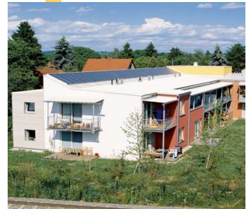
MFH mit 66 m 2 Kollektorfläche, Hohenwartweg, Graz