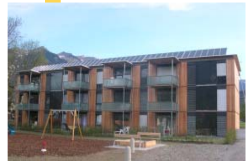
Mehrfamilienhaus mit 120 m 2 Kollektorfläche (1/3 davon als Fassadenkollektor), Ludesch, Vlbg.

INFO: AEE INTEC www.aee.at seminare-aeintec@aee.at