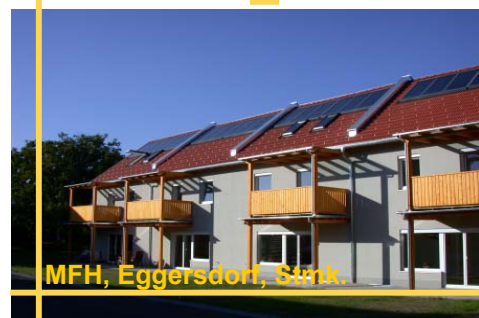
MFH, Eggersdorf, Stmk.

Bauträger: Mag. Feistritzer, Markt Hartmannsdorf Wohneinheiten: 6 (+ Therapieräume) Kollektorfläche / Speichergöße: 30 m 2 / 3000 m 3 Solarer Deckungsgrad vom Gesamtenergiebedarf: 18% Anwendung: BW und Raumheizungsunterstützung Bezugstermin: März 2004 Weitere Infos: r.riva@aee.at