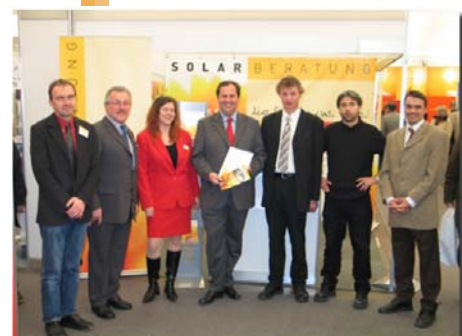
BM Pröll, Austria Solar Vorstandsmitglieder, klima:aktiv und solarwärme Management beim Messestand in Wels