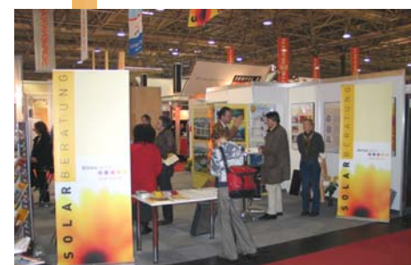
Beratunginsel – Bauen & Energie